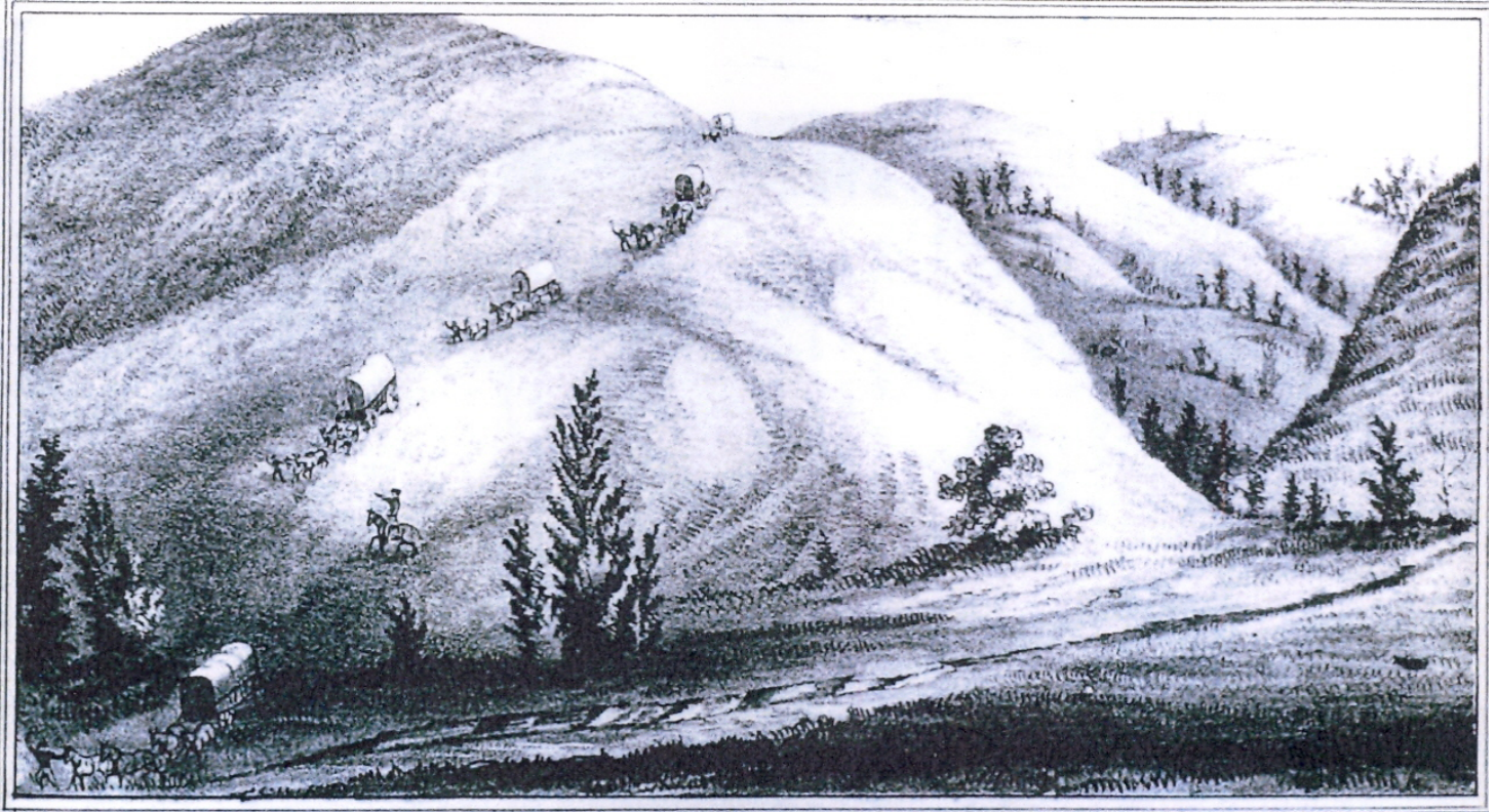
VIEW DESCENDING THE GRAND ROUND FOOT OF THE BLUE MOUNTAIN